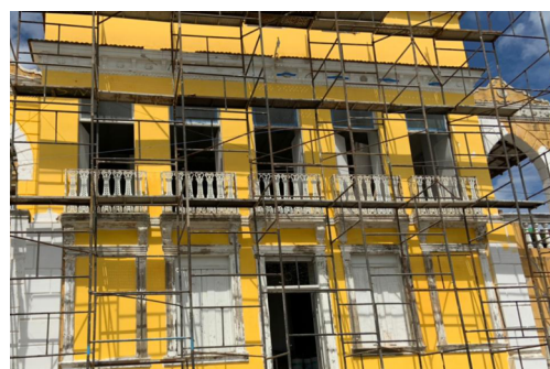
Obras de restauração do Casarão. 2021