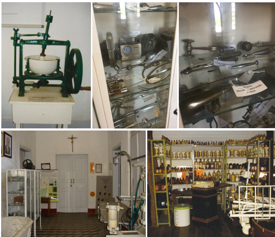
Acervo Imperial Hospital de Caridade. 2021

A implantação do Museu FÁrmaco Hospitalar no Casarão possibilitará não apenas que o acervo seja exposto e estudado de forma adequada, mas também, que o edifício que o abriga demonstre como eram realizadas as atividades da medicina em tempos passados.